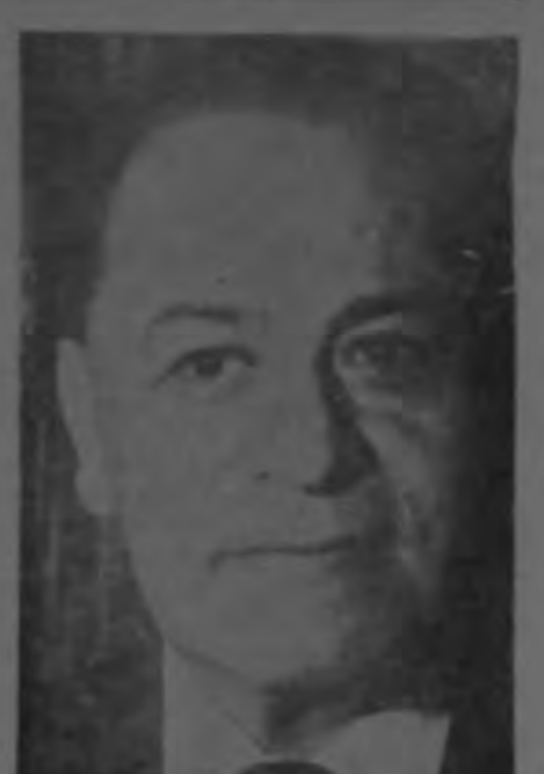
Dr. Tiburcio Carías, Cancellor de Honduras: "venimos para lograr algo práctico. Estoy muy optimista".