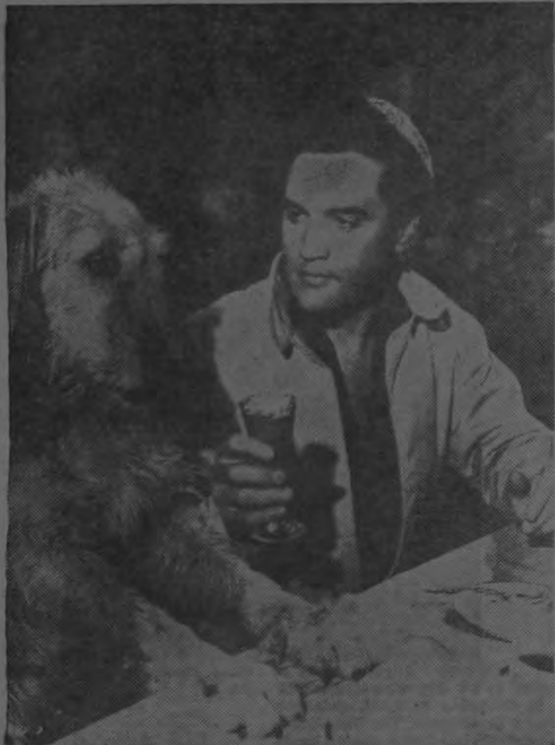
Elvis juguetea con un hermoso perro en la película "Fiesta en California" que próximamente estrenará la Empresa Teatral Urbini".

gi en una de sus primeras producciones, habiendo continuado bajo mi dirección desde entonces hasta su más reciente éxito en la película de la Metro-Goldwyn-Mayer "Fiesta en California". De ello resultó una sólida amistad entre los dos.