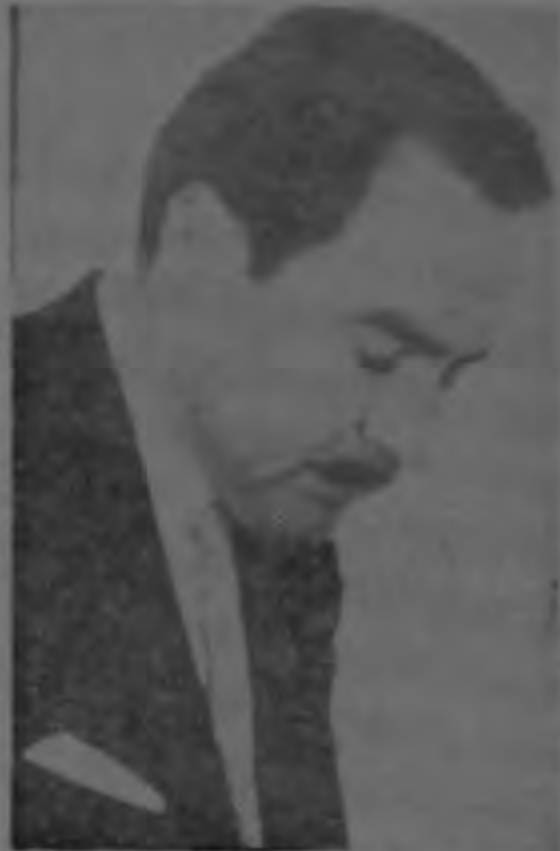
Dr. Emilio Arenales, Cancellor de Guatemala: "países centroamericanos asumen actitud fraternal y de política exterior, aún sin necesidad de un estatuto jurídico que lo haga obligatorio".