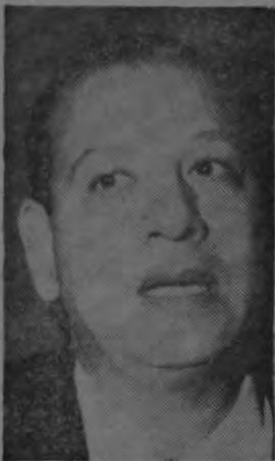
Dr. Roberto Quirós, Cancellor de El Salvador: "debe actualizarse la Carta de San Salvador, reestructurarse la ODECA".

(Viene de la Pág. PRIMERA) estaba seguro, que de esta Segunda Conferencia surgiera ese cambio substancial, pero señaló, que por lo menos saldrán las comisiones para efectuar los estudios preliminares. Entre las fallas que considera el Dr. Quirós, existentes en la ODECA, está su escaso medio económico que se especifiquen de una manera más clara las funciones de los organismos subsidiarios y otros aspectos más".