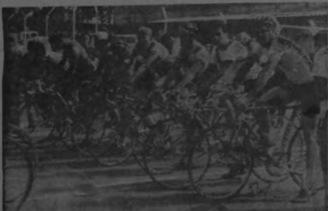
Este pelotón compacto lo forman los nuevos valores del ciclismo que están participando en el campeonato nacional. Lucen condiciones notables y un gran entusiasmo que los puede llevar muy lejos. El domingo todos demostraron encontrarse en magnífica forma.