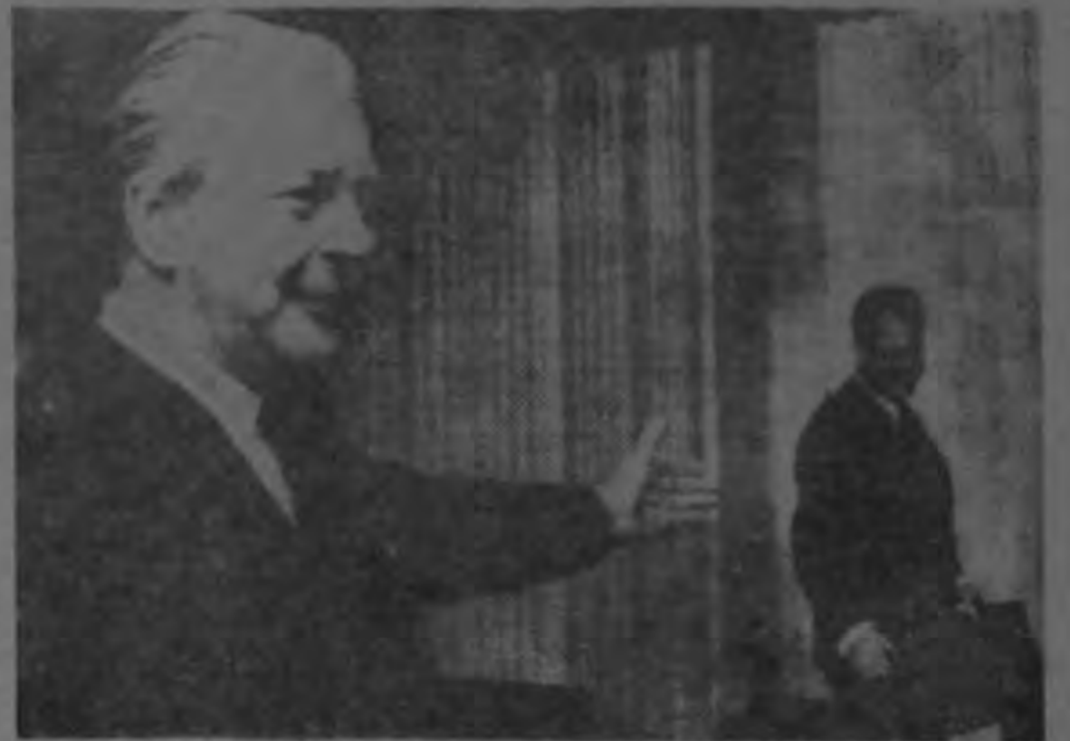
BONN, Nov. 18.—AP—Rudi George Kiesinger, candidato de los Demócratas a la jefatura del Gobierno alemán, señala al Socialista Willy Brandt al sentarse en Bonn hoy para ver si los dos partidos se ponen de acuerdo. 1966

Declaro formalmente inaugurada esta conferencia. Sean bienvenidos. Que sus afanes y trabajos de hoy dejen una impronta en la lucha por la conquista de mejores condiciones de vida espiritual y material para Centroamérica y los centroamericanos.